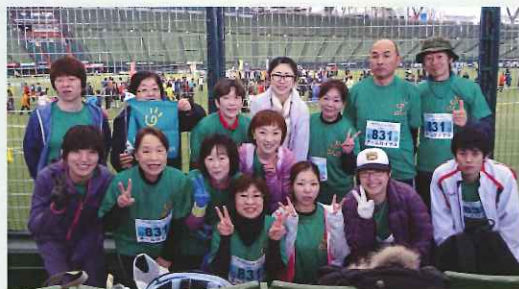
チームロイヤル、がんばるぞ〜