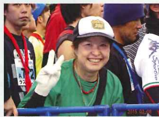
第一走者、行ってきます