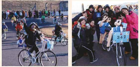
(文/リハビリテーション科・小林)

午前8時にスタートした耐久レースは7時間後の午後3時までAチームは43週、約200Kmを走破し15位の好成績を収めました。Bチームはコースを取り巻く観客の方々の声援に笑顔でこたえるなど、それぞれの形で、それぞれのできる限りを「全部、出し切った」一日でした。