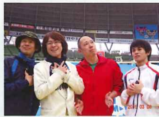
ヨン様団んで、皆でものまね(笑)