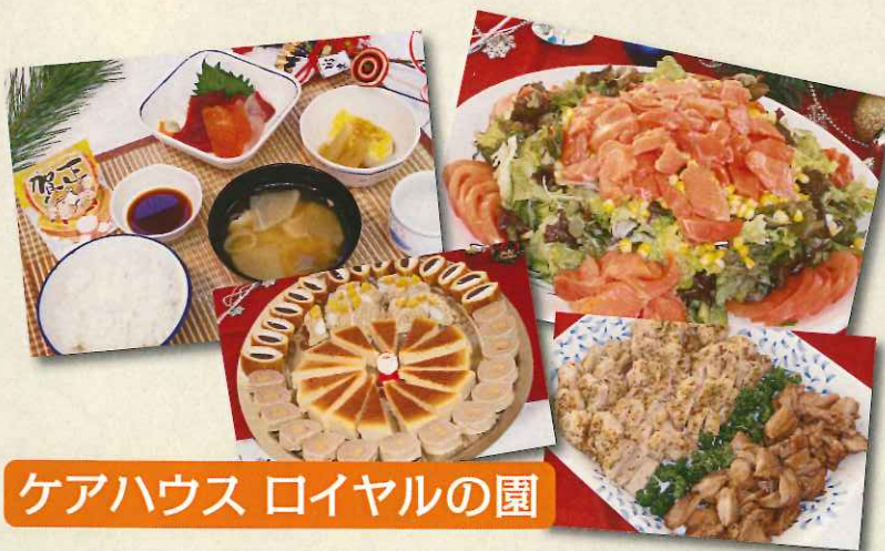
ケアハウス ロイヤルの園

クリスマスにちなんでハンバーグをホワイトソース仕立てにしてみたり、鴨をローストするなど、新しいことも挑戦しました。ご利用者さまの嬉しそうなお顔を励みに、これからもチャレンジし続けたいと思います。