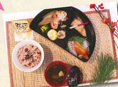
特養ロイヤルの園