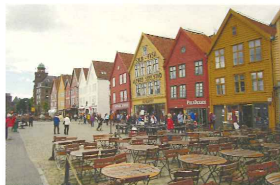
ノルウェー王国の誇る世界遺産「ブリッゲン」

わずか10日間の旅でしたが、どの国も華やかさはないものの、一本筋が通っている印象を受けました。