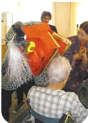
練習の甲斐あって 大迫力の獅子舞披露!