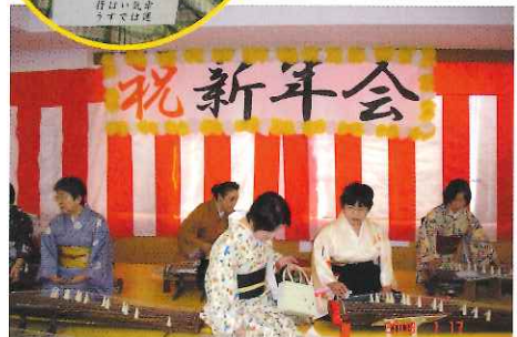
琴の音色に聴き入りました 着物姿の職員は普段より3割り増しに見えますか?