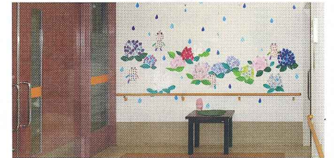
この作品と右下2点の作品を撮影したのは、元カメラマンのミスターXpです。

二人目は、放射線科科長ミスターXp。カメラ歴は20年以上。元々はプロカメラマンとして活躍され、有名芸能人などの撮影もしていたようです。今は趣味として旅行中の風景等を写真に収めているようです。素敵な趣味ですね。