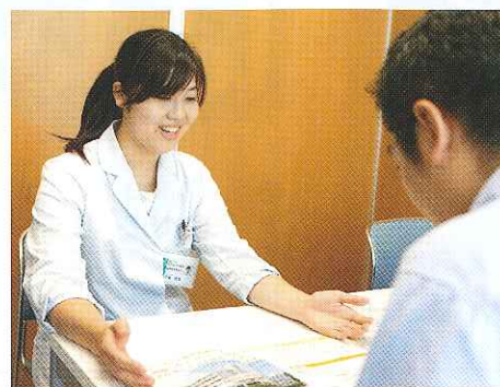
患者さまサポート窓口

入院したばかりでも、患者様が住み慣れた生活の場で療養することを視野に入れて、退院支援に取り組んでいます。当院では、2018年8月に地域連携部に入退院支援室と病床管理室ができました。入退院支援室のMSW(相談員)が病棟配置となっています。そして、それぞれ入院されている病棟に退院支援看護師が配置されています。医師、看護師、MSW、リハビリスタッフ、管理栄養士、薬剤師など多職種で安全・安心して退院が迎えられるようチームでかかわっています。